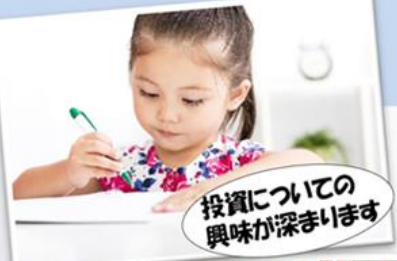
投資についての興味が深まります