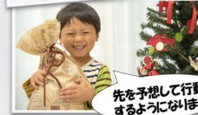
先を予想して行動できるようになります

今回のテーマは「ものつくりと投資」です。 身の回りにあるものはいろいろなものが組み合わさってできているということ、 そして「モノ」の価値を高めるためには 計画的な投資が必要になることをゲームを通じて学びます。 お子様はものの仕組みや投資について、 より深い興味を持つようになり、最終的には創造力やイノベーション、 計画的な時間の使い方まで学ぶことができるような内容となっています。