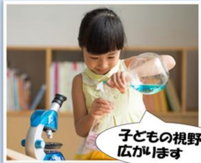
子どもの視野が広がります

【時間】 13:30～15:30 【料金】 2,000円 学童利用者【無料】 【場所】 学童ひまわりクラブ 深江町戊2975-15 【対象】 1年生～6年生 【定員】 20名